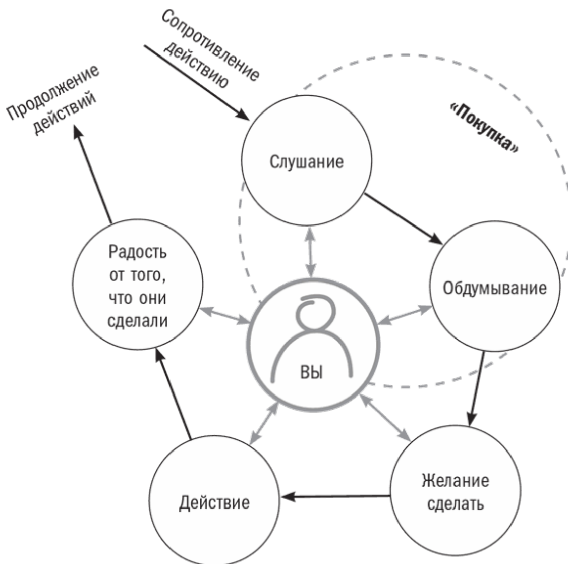
Рис. 1.1. Цикл убеждения

Процесс убеждения проходит поэтапно. Чтобы провести людей от начала до конца цикла убеждения, вы должны разговаривать с ними так, чтобы подтолкнуть, продвинуть их – от сопротивления к слушанию – от слушания к обдумыванию – от обдумывания к желанию сделать – от желания сделать к действию – от действия к чувству радости от сделанного и к продолжению действия.